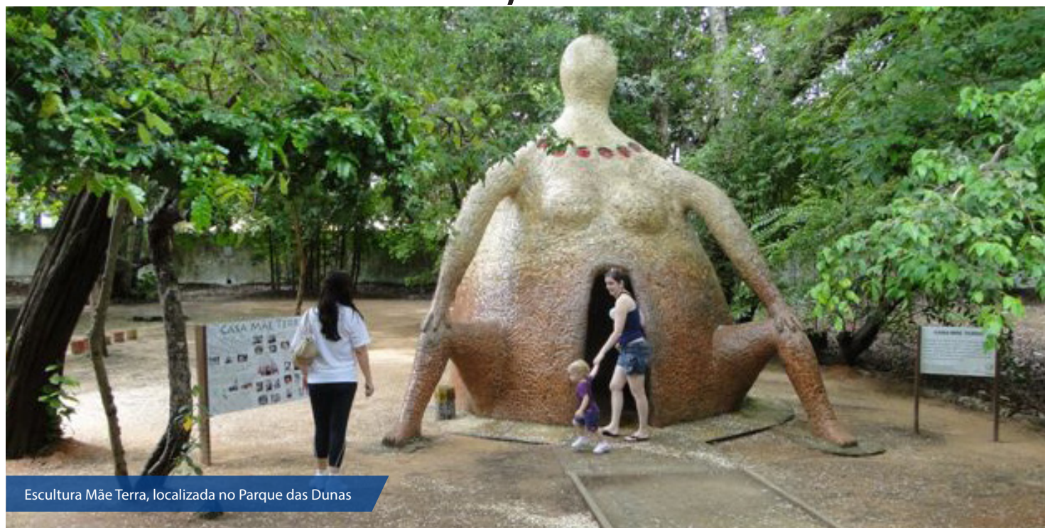
Escultura Mãe Terra, localizada no Parque das Dunas

No último ano, a estrutura apresentou rachaduras e o monumento foi interditado. O serviço foi orçado em cerca de 14 mil reais e contempla malha de ferro, pilares e a utilização de concreto jateado para dar sustentação à escultura. A obra da Casa Mãe Terra deverá ser concluída nas próximas duas semanas e aberta para visitação ainda no mês de Outubro.