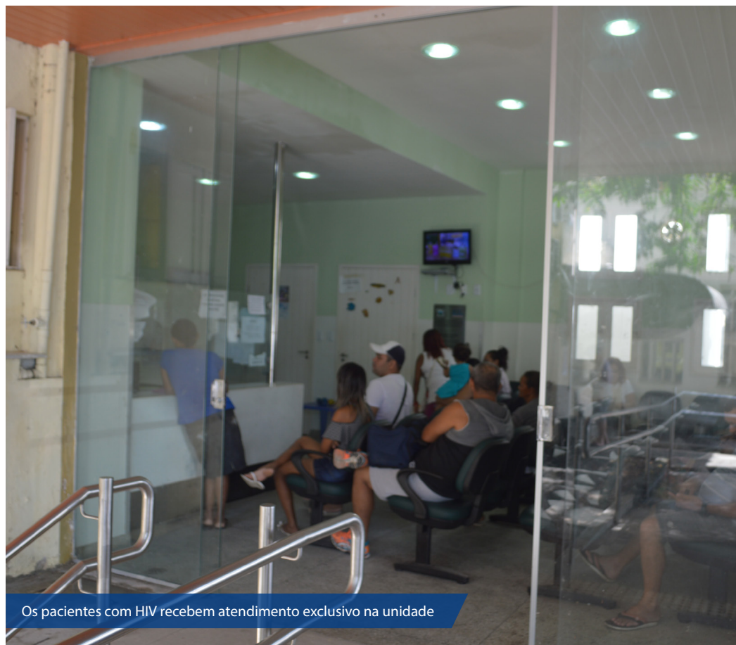
Os pacientes com HIV recebem atendimento exclusivo na unidade

Além do programa HIV/Aids, o hospital é responsável pelo atendimento ambulatorial em Tuberculose, Hepatites Virais, Hanseníase e Calazar. “Os pacientes que não respondem ao tratamento na rede básica e necessitam de procedimentos especializados devem ser encaminhados pelo médico da unidade municipal de saúde, que deverá preencher a Ficha de Referência”. As pessoas atendidas nesses programas contam com os mesmos ambulatórios de especialidades.